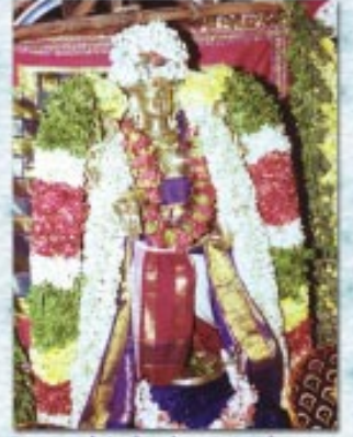
உதயவர் - பக்தகுதிரதலவர்