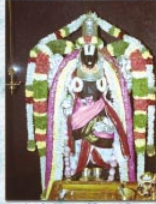
மூலவர் - ஸ்ரீ கல்யாண ஸ்ரீநிவாஸப் பெருமான்

ஸ்ரீ கல்யாண ஸ்ரீநிவாஸப் பெருமாள் திருக்கோயில் மஹா ஸம்ப்ரோஷணம் (17 - 02 - 2002)