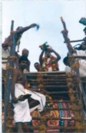
மதுரபுரி ஷேத்ரம், மஹாரணயம் கிராமம், மலைப்பட்டு